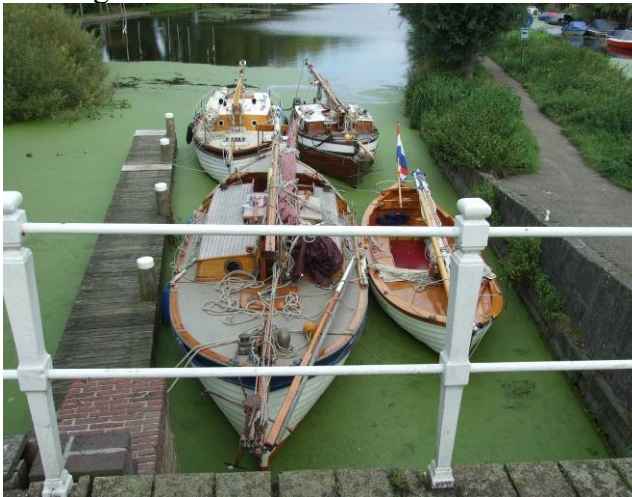
Met een paar sloepen op weg naar de Kaag.