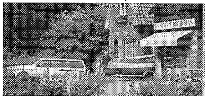
Zo vertrokken we uit Reeuwijk

Wat een prachtig zeilgebied is dit hier toch aan de zuidkant van Bretagne. Wat kleiner dan het IJsselmeer maar met 365 eilanden. Sommige groot,