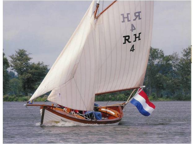
Met windkracht 7 zeilend met volltuig.

In het April nummer van "Watercraft", een Engels botenblad, staat een stukje over de werf en Elisabeth, de zeilsloep. Met prachtige foto's die we hadden gemaakt toen er veel wind stond; eigenlijk teveel, maar voor een goede fotoserie moet je natuurlijk wat risico's nemen, het resultaat is er dan ook naar. Ik hoop dat er nog wat belangstelling voor deze sloep binnenkomt, ik ben bezig om het nieuwe prototype klaar te maken.