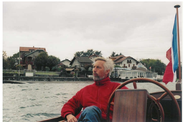
Nog helemaal niet wetend wat ons te wachten stond.