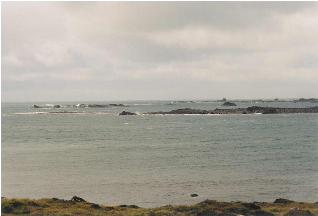
De ruige kust van Bretagne in de winter.

Terugrijdend met mijn oude Volvo van 18 jaar bleek dat de versnellingsbak nu echt lawaai ging maken, dus heb ik die toch maar laten reviseren want ik ben aan die auto toch wel een beetje gehecht. Hij rijdt nu weer heerlijk stil.