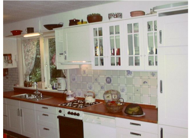
Makkumer tegeltjes uit Harlingen.

Ja, we realiseerden ons dat we hier alweer 17 jaar wonen en in het begin nou niet bepaald de tijd namen om een en ander naar onze zin te verbouwen. Maar nu dus wel: we hebben de scheidingswand tussen keuken en kantoortje weggehaald om een grote woonkeuken te realiseren. Tegels op de vloer, nieuwe deurtjes voor de kastjes, een paar nieuwe kasten erbij, nieuwe aanrecht, wasbak, kraan, lampjes; het klinkt allemaal zo simpel, maar wat een hoop werk was dat!