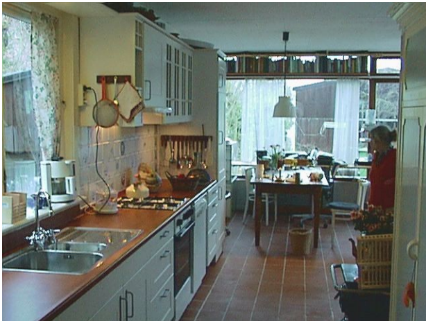
De woonkeuken bijna klaar.

Wat een slappe winter; zo weinig vorst heb ik nog nooit meegemaakt; hoewel je niet elke winter kan schaatsen (laat staan ijszeilen) was er deze winter geen enkele keer dik genoeg ijs om zelfs maar op een slootje even op het ijs te staan; volgens mij een unicum. Jammer, maar ik had toch niet zo lang kunnen schaatsen want we hebben de keuken verbouwd.