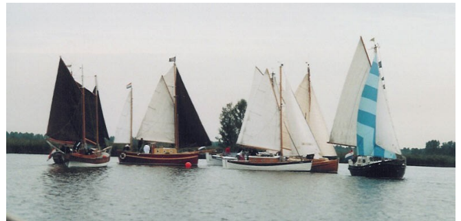
Gedrang bij de boei tijdens de sloepenrace op de Kaag